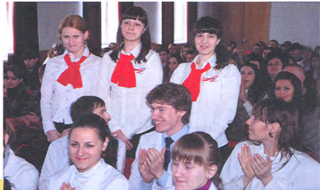
Переможці Всеросійської олімпіади з фармації – команда Уральської державної медичної академії (м. Єкатеринбург)