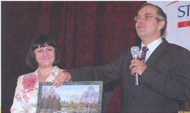
Подарунок від російської землі